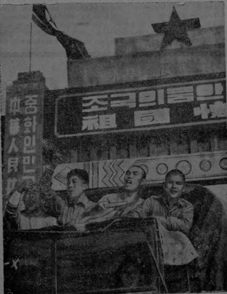
Un grupo de prisioneros comunistas que decidieron regresar junto a los rojos, saludan y gritan al pasar bajo un arco coronado por una estrella roja. Mientras, la Comisión de Repatriación de Naciones Neutrales ha admitido su derrota ante la negativa en masa de los prisioneros norcoreanos anti-rojos a escuchar a los "convencedores" comunistas y se dispone a pedir sugerencias respecto a como encarar la situación.